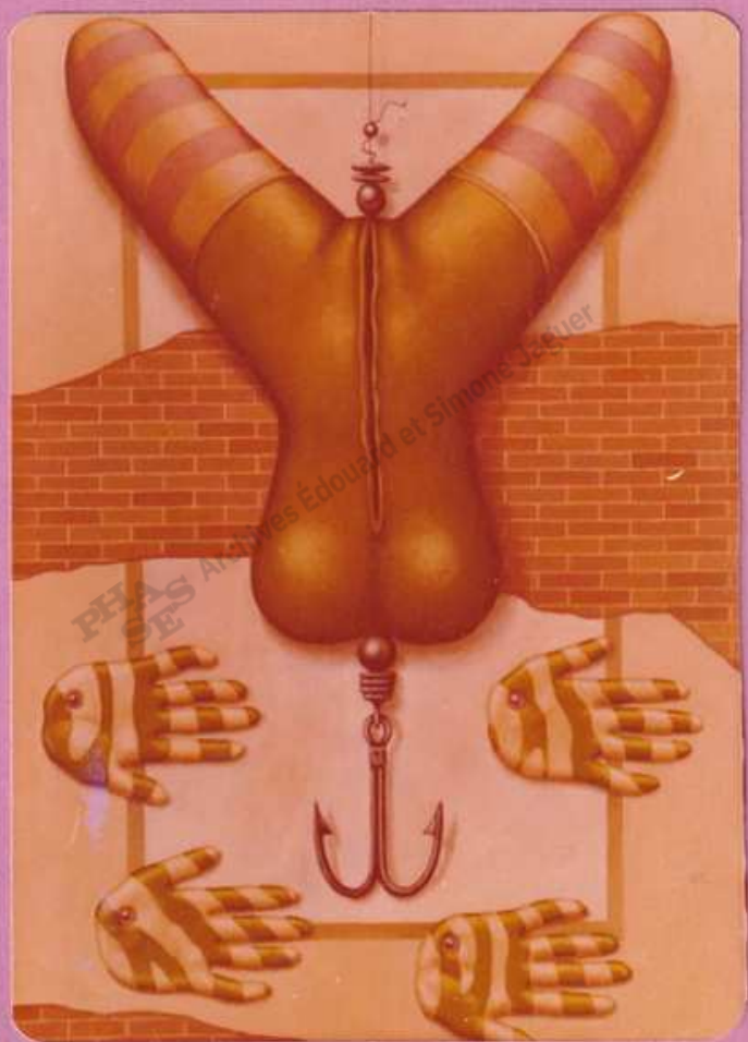
The Lure (II) 1977.